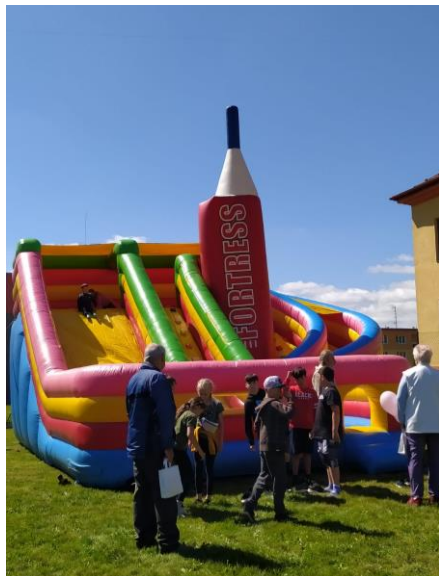
Martin Maleček, starosta města

Dovolujeme si Vás pozvat na naši tradiční společenskou akci Oslava dětského dne v Hroznětíně. Akce se koná 3. června 2023 od 14.00 do 17.00 hodin na Multifunkčním veřejném sportovišti v Hroznětíně u základní školy. Pro děti jsou připraveny soutěže, skákací hrad, dětská diskotéka, malování na obličej i malý dárek. Občerstvení pro děti a dospělé zajištěno.