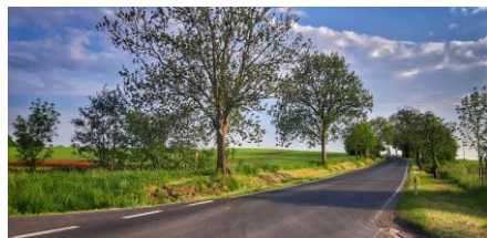
Veronika Nepívodová - Na křižovatce

Snímky svými hlasy vybrali hlasující na webových stránkách, knihovním facebookovém účtu a osobně v knihovně. Do hlasování se tentokrát zapojilo 70 lidí, kteří vybírali ze 13 zaslanych fotografií.