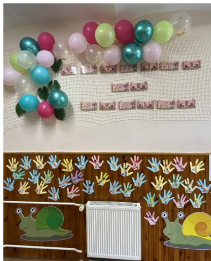
kolktiv MŠ Hroznětín

Těšíme se na nový školní rok plný radosti, objevování i společných zážitků a přejeme všem dětem úspěšný start a mnoho krásných chvil ve školce.