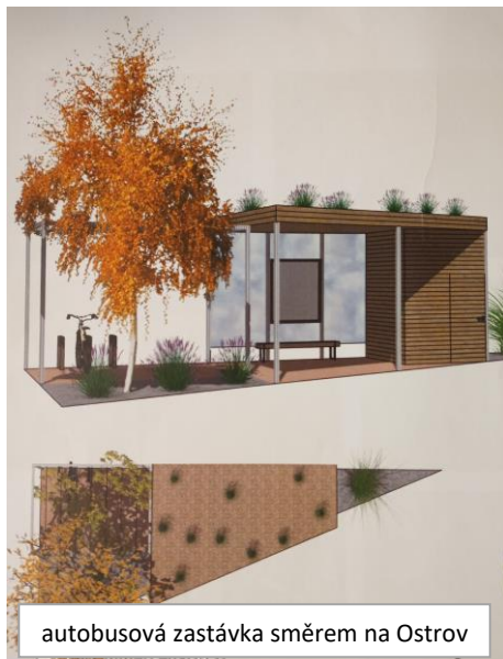
autobusová zastávka směrem na Ostrov

Celý projekt s rozsahem dotčených ploch Vám představíme na veřejném projednání a prezentaci, o jejímž termínu Vás budeme informovat v příštím zpravodaji.